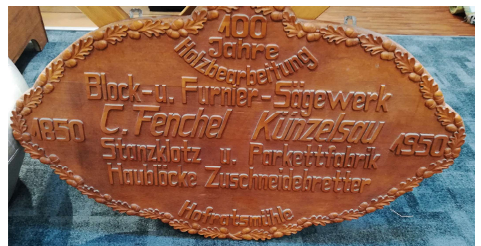
Präsent zum 100. Firmenjubiläum im Jahre 1950.

Damit waren die Fenchels seit dem 07. Juli 1850 Besitzer der Hofratsmühle und haben sich durch Carl Fenchel mit Ölmühle und einem Holzsägewerk zu einem bekannten mittelständischen Unternehmen im Hohenlohekreis für die Verarbeitung und Gestaltung von Wohnprodukten im privaten und gewerblichen Bereich entwickelt.