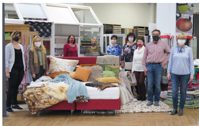
Das Verkaufsteam in der neugestalteten Ausstellung.

2018 wurde der Store in Künzelsau in der Würzburger Straße neu und kompakter neu strukturiert: Stilvolle Dekoartikel und Wohnaccessoires zieren den Eingangsbereich der vielseitig aufgestellten Verkaufsfläche, die zweistöckig dem Kunden ein exklusives Sortiment mit Wohlfühlfaktor anbietet. Hier findet man eine große Auswahl von Parkett-, Kork- und Designböden, ein buntes Farbsortiment mit Teppichmustern, aber auch hochwertige Heimtextilien namhafter Hersteller. Auch Polsterarbeiten werden angeboten, um Sessel oder Eckbank wieder