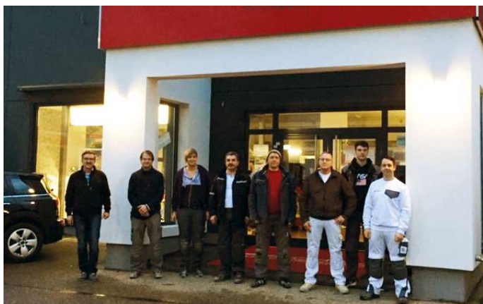
Das Fenichel-Außendienstteam vor dem neuen Store.

Moderne Raumgestaltung mit individuellen Wünschen wird mit handwerklicher Facharbeit und hochwertigen Materialien umgesetzt. Dabei steht dem Kunden ein geschultes Mitarbeiter-Team gerne mit guter Beratung zur Seite.